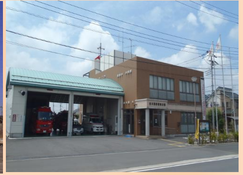
吉川消防署南分署