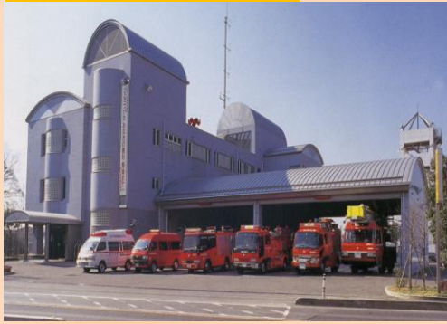
消防本部・吉川消防署